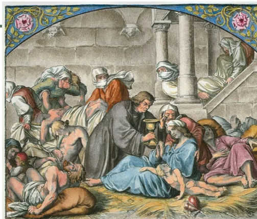
路德於瘟疫中服侍

無論何時、何處都有危險，歷世歷代逆境困難不絕，但耶和華是我們的牧者，我們必不至缺乏。