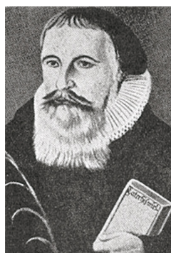
Martin Rinkart 牧師

約100年後，「三十年戰爭」在歐洲爆發，當時的薩克森被敵軍蹂躪，戰火連天，民不聊生，數千家庭受害，饑荒發生，最後更發生瘟疫。其時一位名為Martin Rinkart的路德宗牧師，雖然身邊的同工因病倒下，仍堅守崗位，四處照顧病人，好一段時間，每日的工作便是主持喪禮，一天主持50多次安息禮拜。瘟疫戰爭過後，他並沒有怨言，反寫下一首我們熟悉的詩歌《都來感謝上帝》(舊版頌主聖詩43首)。此詩歌被視為路德會其中一首代表詩歌，告訴我們面對逆境不一定埋怨，反可感恩關愛地服侍。