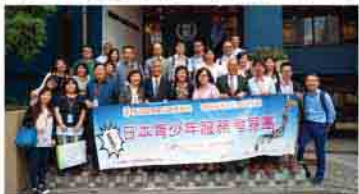
日本青少年服務考察團到訪明聖高等學校