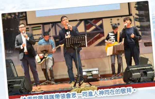
沐恩堂敬拜隊帶領會眾一同進人神同在的敬拜。