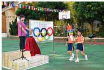
小型奧運會開幕典禮