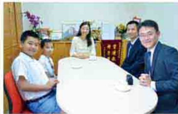
學生與青年外交官面談