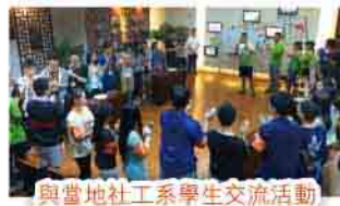
與當地社工系學生交流活動