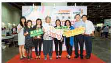
本處提名合作企業領取商界展關懷標誌