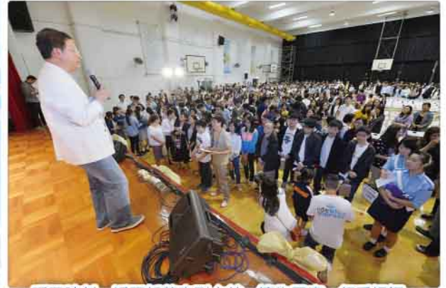
呼召時刻，近百新葡來到台前，禱告回應，領受祝福。

沉睡的小草衝破堅硬的土壤，領受從主而來的陽光。小草隨著和煦輕風搖曳生姿。如斯美景讓我們回想起主耶穌的恩典和慈愛。蒙上帝的恩慈，本校周年佈道大會得已圓滿舉行。