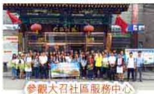
參觀大召社區服務中心