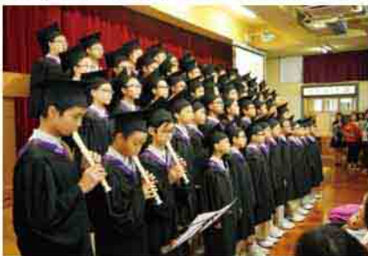
同學依依不捨地唱畢業歌