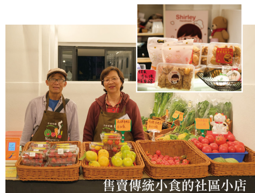
售賣傳統小食的社區小店

「聯和市場—城鄉生活館」善用單層呈「E形」室內空間及兩旁戶外廣場，提供常設展覽區、工作坊區、社區小店、餐廳、咖啡店、公眾戶外廣場及附屬樓（可舉行預約單車導賞團活動）等六大元素，既保留原有文化特色及昔日模樣，同時結合了現代生活元素，讓公眾了解更多昔日香港農業文化、城鄉生活文化及習俗。城鄉生活館有一個別名為「聯和趁墟」。「趁墟」，代表人頭湧湧湊熱鬧。寓意讓此成為粉嶺地標，歡迎大家來到「聯和趁墟」趁熱鬧，一同體驗城鄉生活風情！