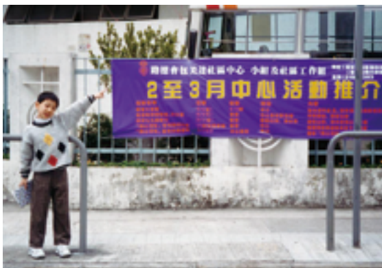
王教授兒時於路德會包美達社區中心留影