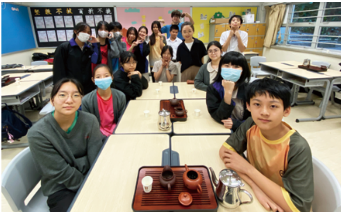
茶香撲鼻，中國茶藝經典

學生親身體驗無疑是非常重要的，因此我們安排文化實地考察，前往內地不同地方交流。例如「東莞文化之旅」讓學生了解中國企業的成長故事，企業家如何成功地將中國傳統食品推向世界；又如剛於復活節期間