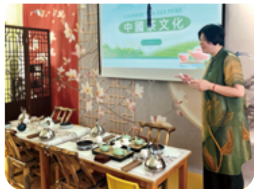
專業茶藝師到校講解 ▶ 茶文化及示範泡茶