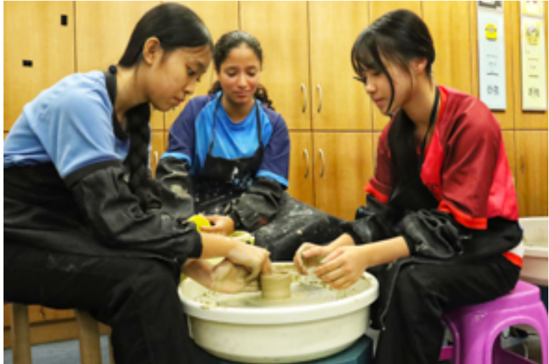
本地生與非華語生一起學習陶瓷製作

中華文化的傳承不僅要根植於自身的歷史與文化，更要放眼全球，與世界各國的文化進行對話。我校善用國際文化校園的優勢，開展與其他文化的交流活動，讓學生在比較中理解中華文化的獨特性，擴闊他們的全球視野。例如，本學年首次舉辦「非華語學生文化嘉年華」，邀請非華語學生用多元的方式分享他們所屬國