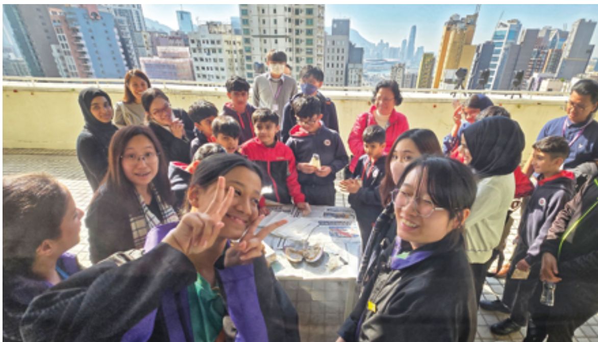
結合科學、中國傳統文化的開珍珠蚌活動