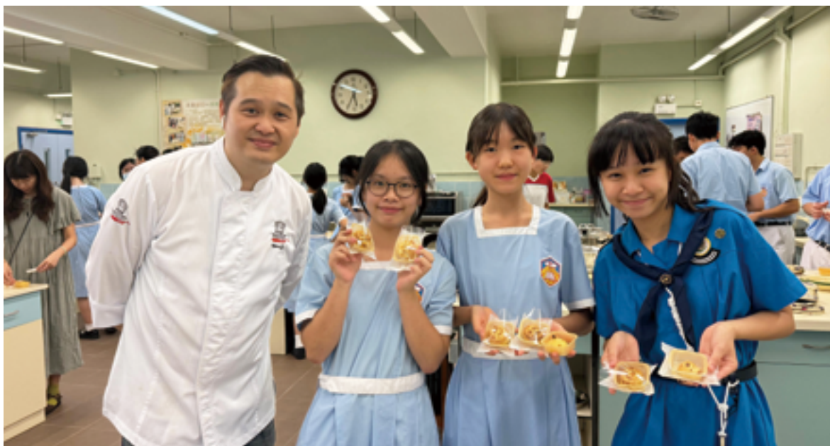
參與者親身製作月餅，體驗中華文化之「甜」

中史科在學校舉辦的中秋月餅製作工作坊，就是一個典型的例子。通過親手製作月餅，學生不僅能夠認識中秋節的慶祝文化，還能體驗傳統手工藝的魅力。