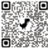
家長到校觀賞 泡茶心聲