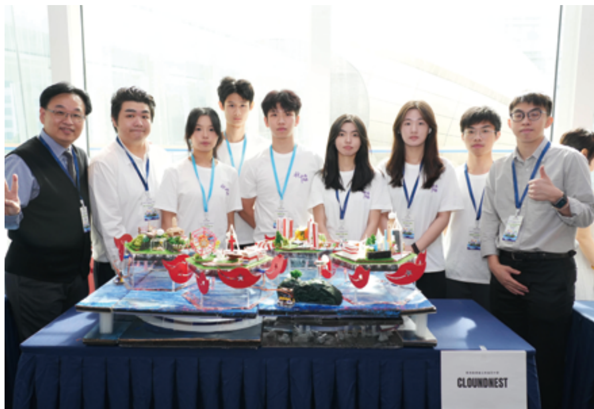
在「未來之城」香港區選拔賽 2024 榮獲香港中學組亞軍、最佳模型設計獎、最佳造型服飾及最佳演繹大獎

隨著科技發展和社會變遷，我們通過嶄新的方式促進文化創新。例如視藝科教導學生利用陶瓷技術製作咖啡杯，參與「趁墟做老闆」的營商活動；運用現代科技讓學生學習中國傳統武術—詠春；引入 Icade 運用虛擬實境技術重現歷史場景等。此外，本校 STEAM 科老師帶領學生代表香港到北京參加「未來之城®」比賽，學生有幸和中國其他省份的同學交流，共同設計中國的未來城市。通過與來自全國的隊伍競爭，學生不僅展示了自己的創意和努力，還了解到不同省份的同學如何將地方文化特點融入未來城市的作品，從而學習到中國各地的優秀文化。