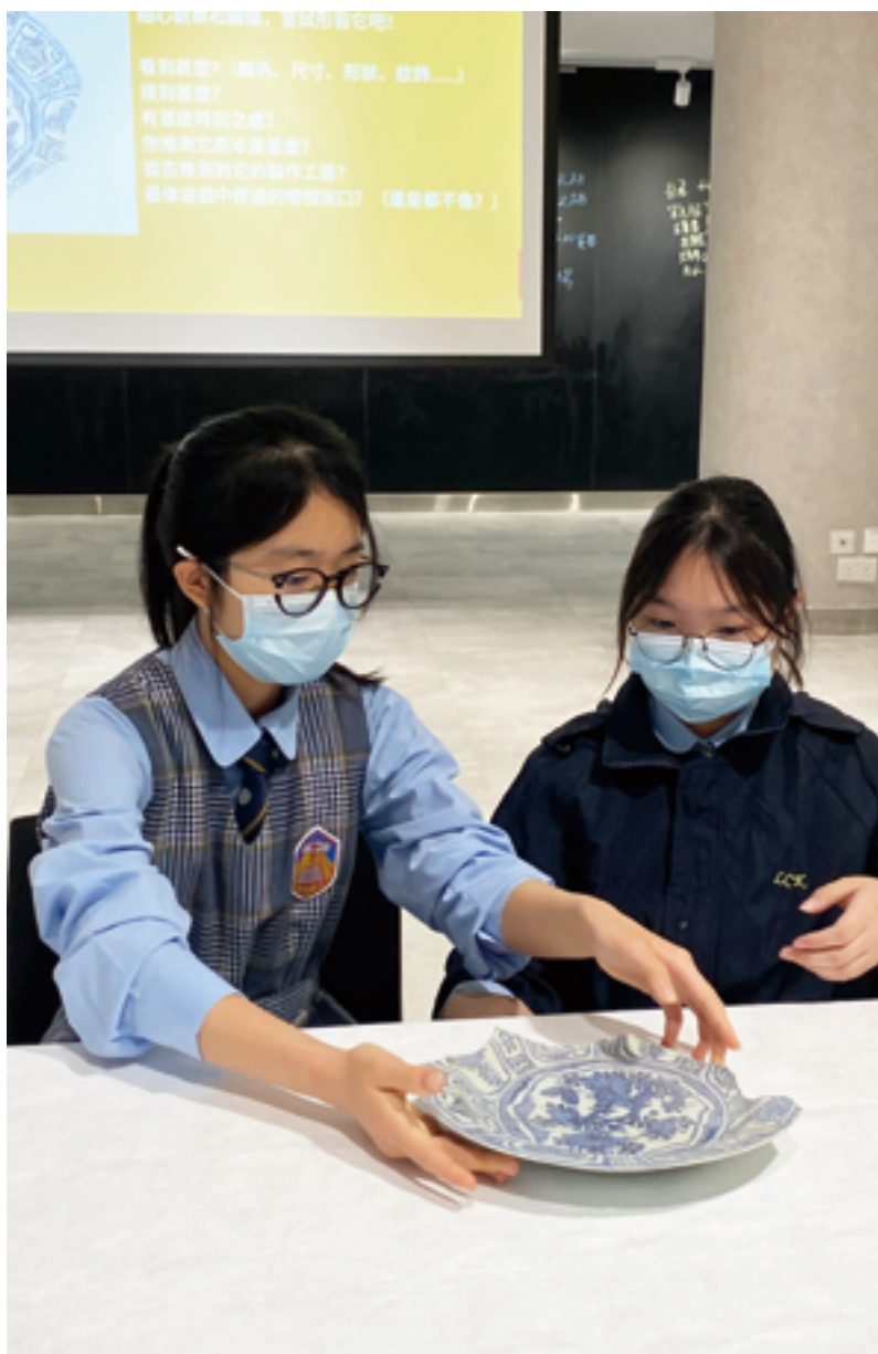
學生在文物研習工作坊學習小心翼翼地鑑賞文物，從而領略文物保育的重要性。

總之，本校通過中文科和中史科的核心課程，結合跨學科合作與多元化的課餘活動，致力於在中華文化的傳承與創新中培養學生的文化自信與全球視野。這種教育模式不僅有助於學生建立對中華文化的深厚情感，也為他們未來的發展提供了廣闊的空間與無限的可能。弘揚中華文化需要學校、教師與學生的共同努力，只有通過系統化的教學設計與多元化的實踐活動，才能真正實現文化的傳承與創新。