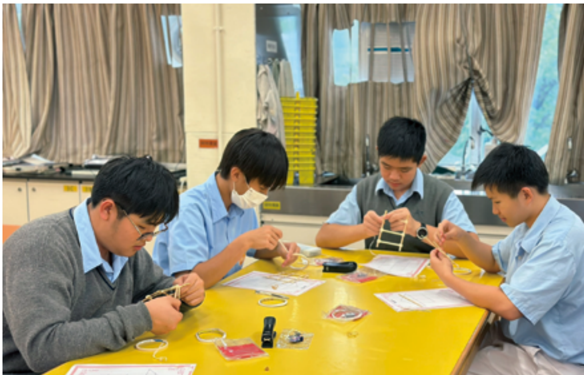
花牌製作活動——學生親身製作，延續中華文化之「情」

除了課堂教學，本校還通過中文學會和歷史學會籌辦多元化的課餘活動，進一步推廣中華文化。例如，學校曾舉辦花牌製作工作坊，讓學生了解這一傳統藝術的歷史與技藝。此外，點茶畫活動也深受學生喜愛，通過親身體驗，他們能夠更深入地理解中國茶文化的內涵與美學。