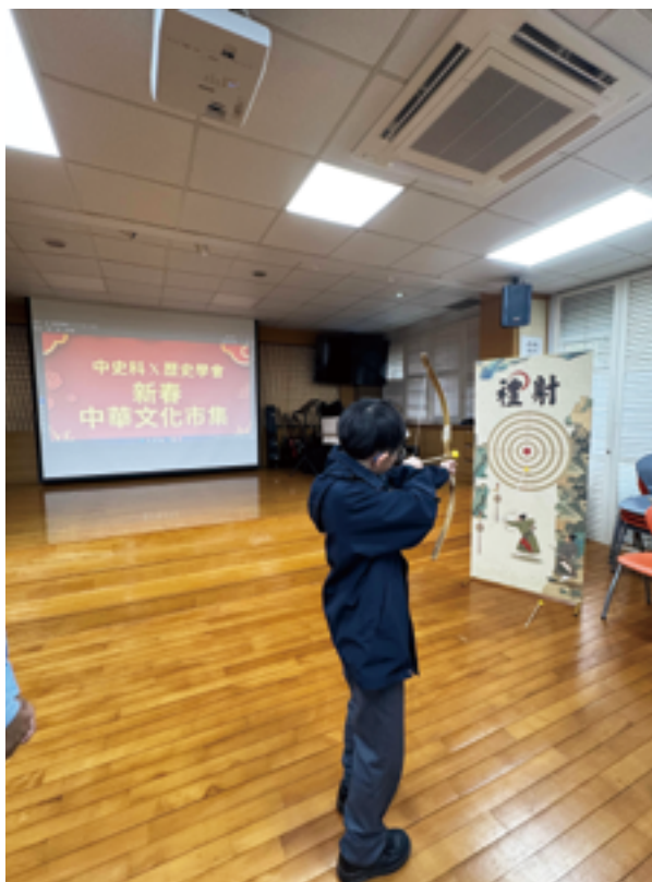
新春中華文化市集射禮 ►

此外，本校還籌辦了新春中華文化市集，邀請學生主持帶領中華文化體驗活動，如射禮、古代小吃等。這些活動不僅豐富了學生的課餘生活，也讓他們在實踐中感受到中華文化的多樣性與活力。