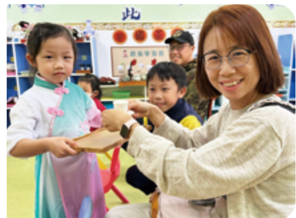
學習奉茶給師長及家人