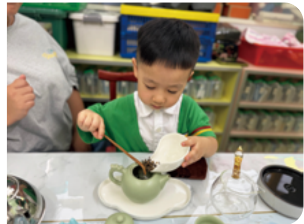
家長協助幼兒進行泡茶