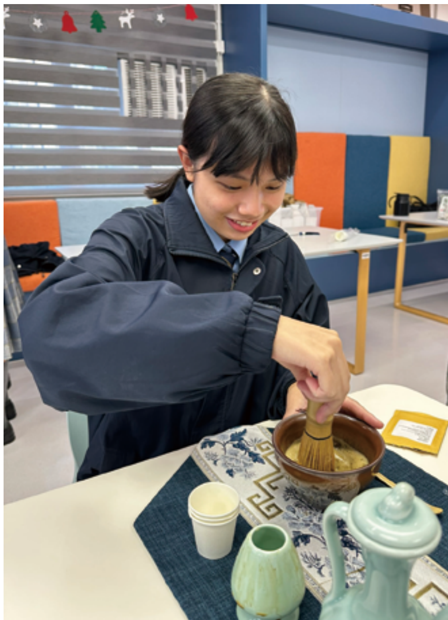
點茶畫活動，學生享受中華文化之「逸」

值得一提的是，中史科與香港中文大學文物館合作開展了「文物研習工作坊」，這項活動讓學生有機會親身接觸宋元瓷器，並在專家的指導下學習文物鑒賞與文化保育的知識。通過近距離觀察瓷器的紋飾、工藝與歷史背景，學生不僅能夠感受到古代工匠的智慧與匠心，還能深刻理解文化保育的重要性。這種沉浸式的學習體驗，讓學生在實踐中培養對中華文化的熱愛與責任感。