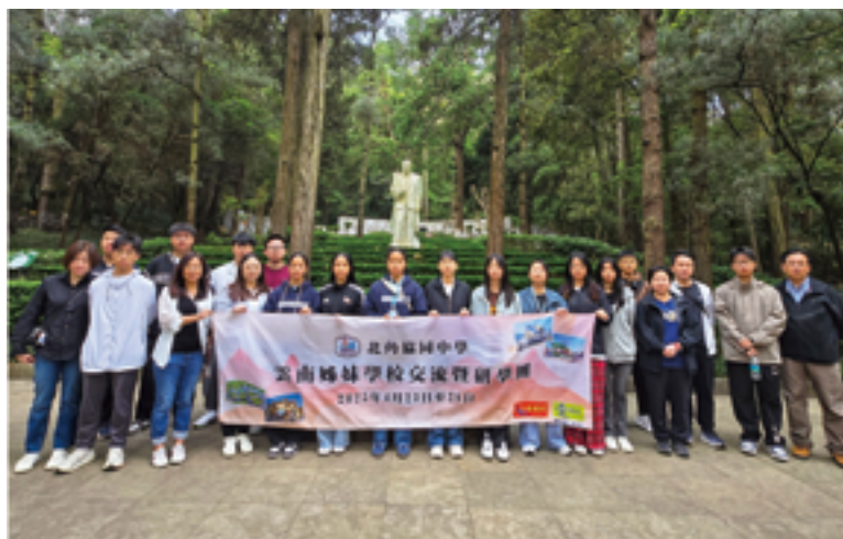
到國歌作曲音樂家聶耳墓園憑弔

舉辦「雲南姊妹學校交流暨研學團」，讓學生通過實地考察感受中華文化的魅力，通過與姊妹學校的交流、參觀中科院撫仙湖太陽天文台、撫仙湖天文體驗館、聶耳墓等，提升學生的國民身份認同及文化自信。