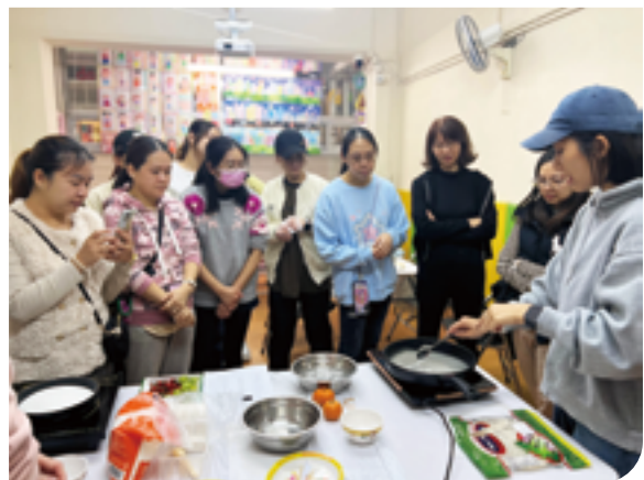
家長冰糖葫蘆製作班