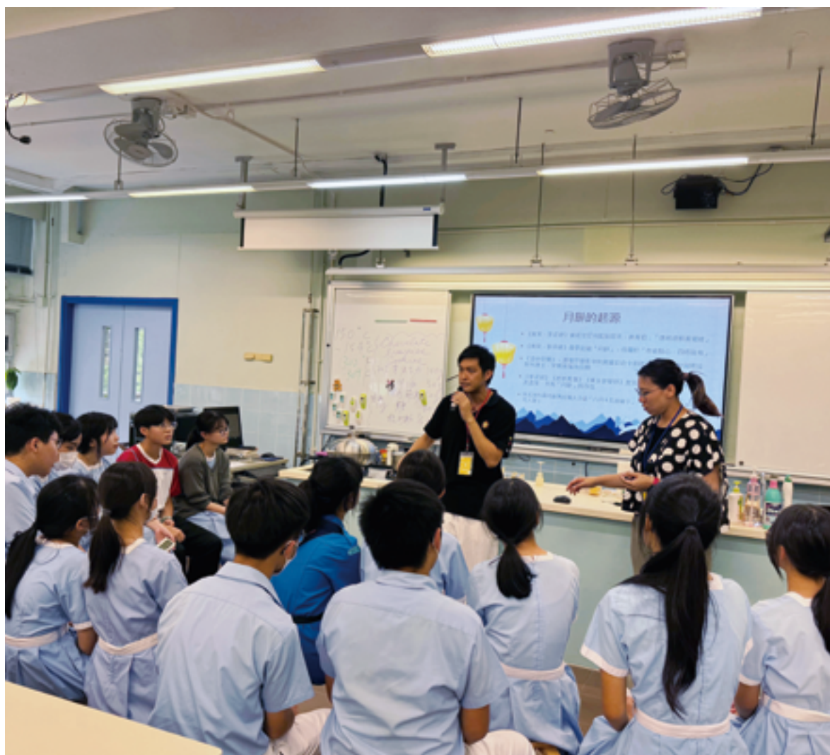
中秋月餅製作工作坊——導師講解中秋節起源