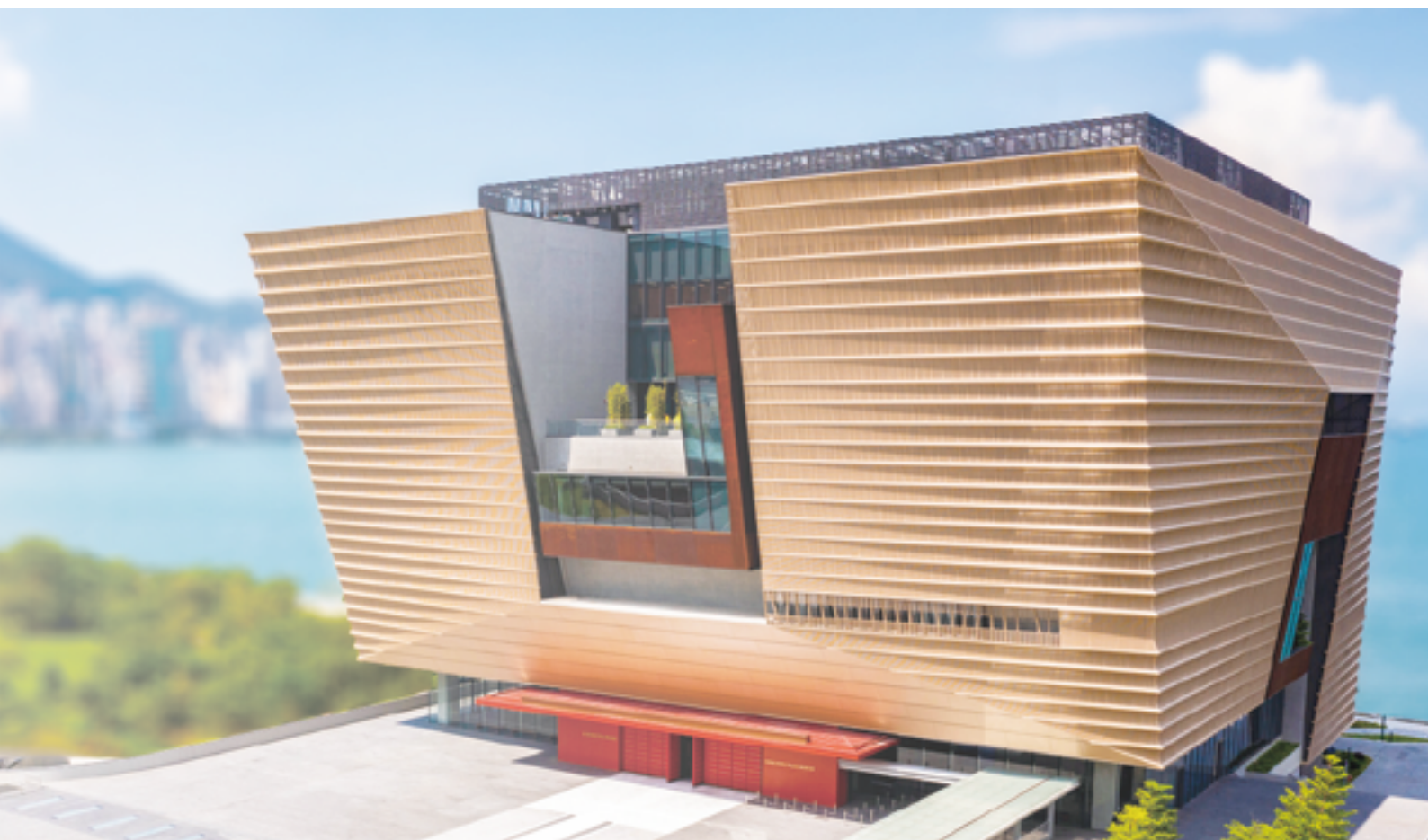
香港故宮文化博物館