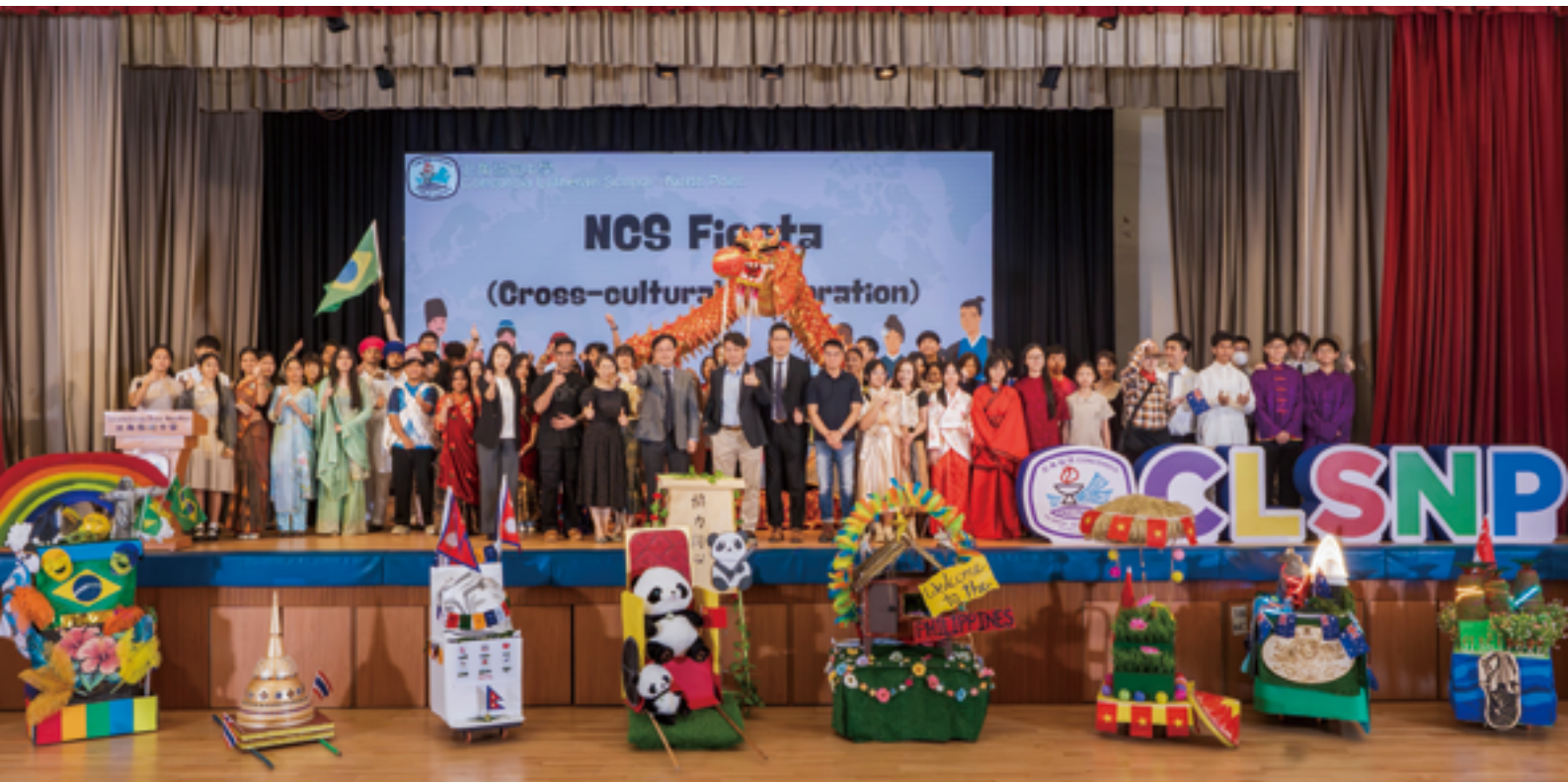
結合各國文化及 STEAM 的活動 花車設計及巡遊

總的來說，中華文化的傳承與創新是教育的重要使命。我校通過不同的的方式融入中國傳統文化，展示中華文化的多樣性和深層底蘊，提升學生的文化素養，並且增強他們的文化自豪感，拓寬他們的全球視野。面對未來，我們將繼續努力，把中華文化推向更廣闊的舞台，讓其在全球化的浪潮中綻放出更加璀璨的光芒。