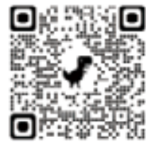
舞獅表演家長分享