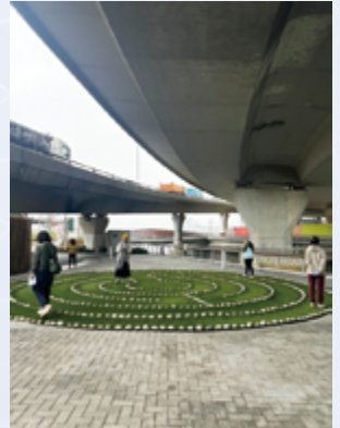
舉辦啟發週末活動，同工於觀塘翠屏河明陣安靜默想

願上帝繼續引領社會服務處同工，在日常生活中活出愛與盼望，成為彼此道路上的光與陪伴。