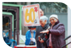
開幕禮邀請居住至今60年的居民分享