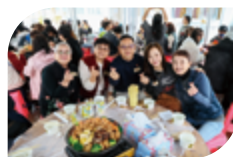
簡女士 (右二) 與堂會及該處代表合照留念