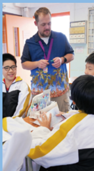
羅布到訪本會中學

小時候，許多人認為他不可能高中畢業。但他不但畢業了，還拿到焊接證書、成為鷹級童軍，並穩定工作超過十年。