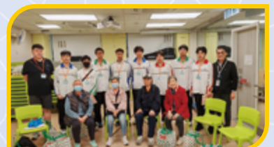
高中同學參與「教、學、社」，和長者義工一齊探訪獨居或雙老長者