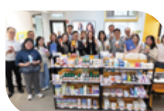
該處高層職員率先購買產品，以行動支持藥房