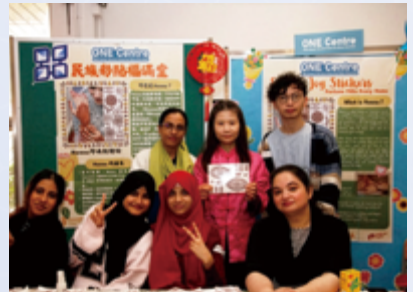
ONE Centre 參加呂小的中華文化活動，增加少數族裔人士對中國傳統節日與習俗的認識，同時他們亦向該校師生分享其富民族特色的彩貼，透過學校與社會服務單位的協作，促進共融文化。

了解的機會，分享各自的新年習俗及文化特色，促進文化交流與社會共融。此外，活動還增進師生及家長對本會社會服務的了解，加強學校與社會服務單位之間的連繫。