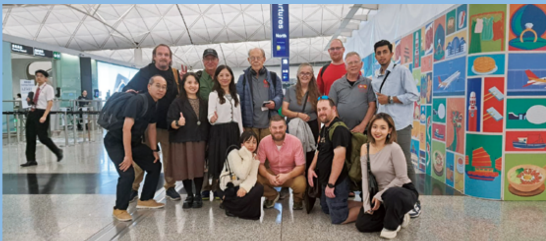
羅布（前排右二）每年都會來香港分享福音