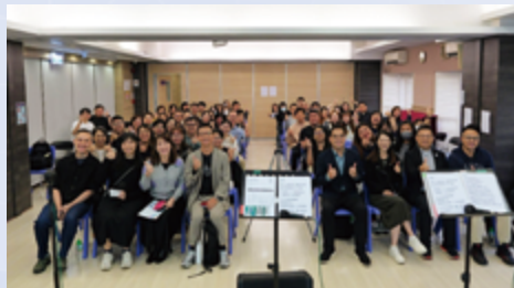
在包美達社區中心為同工舉辦「有故事的歌」音樂分享會，藉詩歌、信主經歷後彼此分享