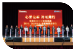
高層職員進行誓師儀式