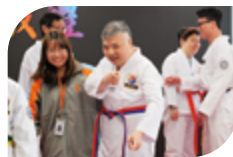
一眾宿友表演跆拳道