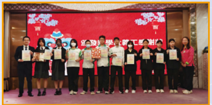
高中同學參與「教、學、社」，在團年飯中服務長者