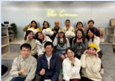
傳恩堂林家健牧師在默想活動後帶領同工分享工作與信仰的關係